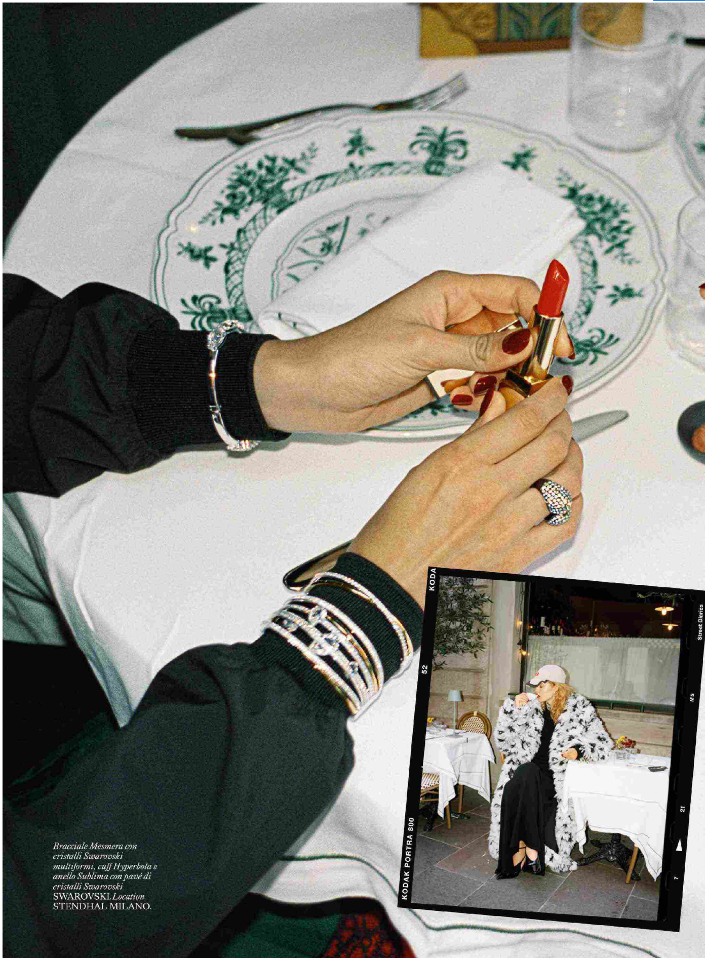
Bracciale Mesmera con cristalli Swarovski multiformi, cuff Hyperbola e anello Sublima con pavé di cristalli Swarovski SWAROVSKI Location STENDHAL MILANO.

Ritaglio stampa ad uso esclusivo del destinatario, non riproducibile.