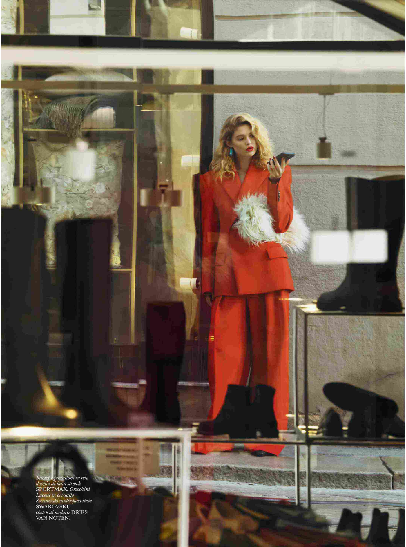
Blazer e pantaloni in tela doppia di lana stretch SPORTMAX. Orecchini Lucenti in cristallo Swarovski multifaccettato SWAROVSKI, clutch di mohair-DRIES VAN NOTEN.

Ritaglio stampa ad uso esclusivo del destinatario, non riproducibile.